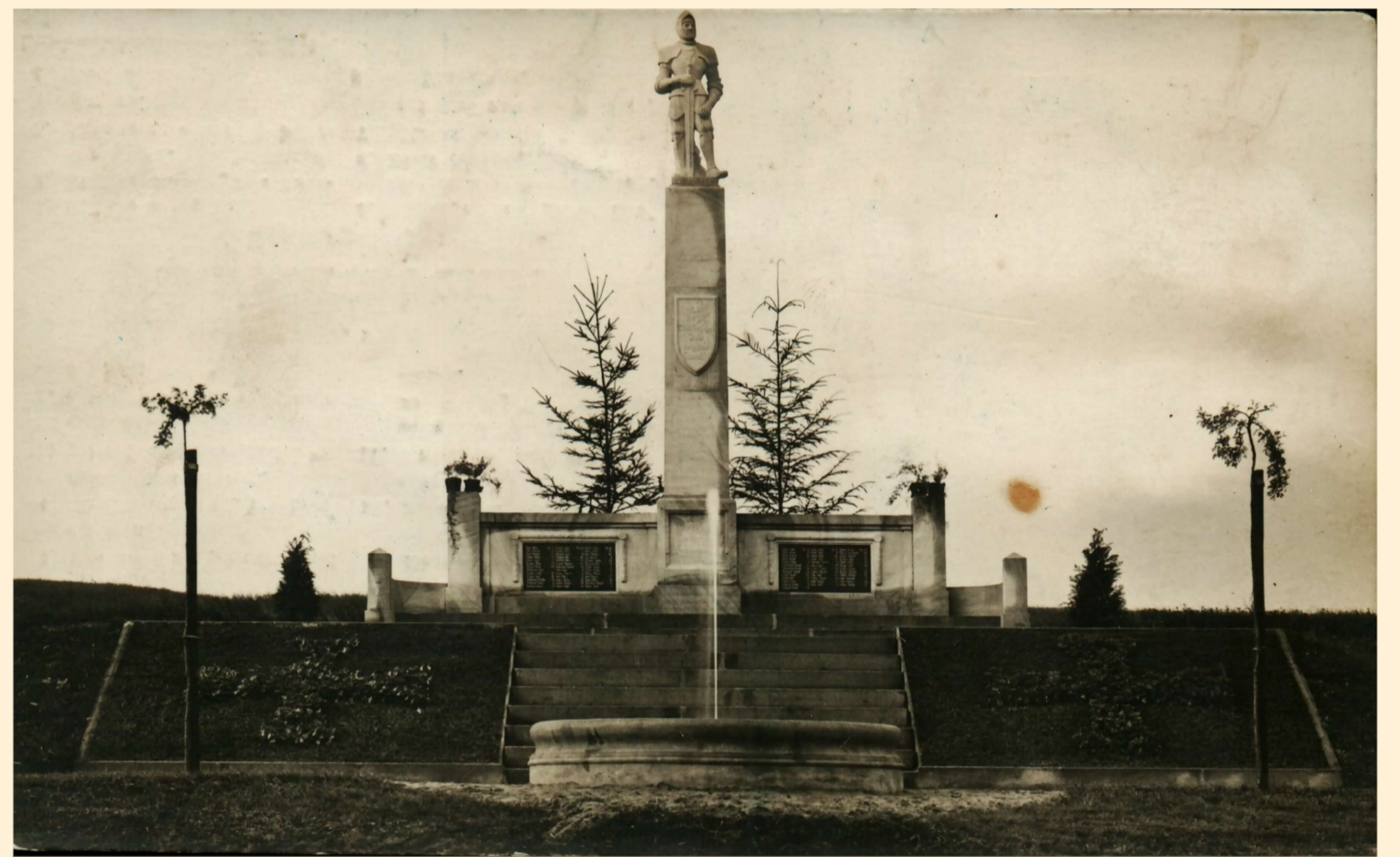
FOTOGRAFIE PAMÁTNÍKU OBĚTEM PRVNÍ SVĚTOVÉ VÁLKY Z DOBY JEHO ODHALENÍ V ROCE 1924

Po konci první světové války bylo Saintgermainskou smlouvou stvrzeno udržení hraničních oblastí Československé republiky, v Čechách s převážně německy mluvícím obyvatelstvem. Na Broumovsku byl tento proces podle pramenů přijat s mírnou nevolí, kterou ukončily oddíly československých legií a zamezily tak svou přítomností větší snaze místních o oddělení se od mladé republiky. Život v obci se tak začal pomalu navracet do kolejí, kde byl před válkou, jen se změnou státního aparátu. Stále však bylo nutné se vyrovnat s hrůzami a ztrátami tzv. Velké války. Na bojištích bylo nasazeno 204 mužů z obce, z nichž 63 válku nepřežilo. Spousta vojáků sloužilo u 18. pěšího pluku, který byl verbovacím obvodem pro tehdejší Hradecký kraj. Většina z nich si prošla bojištěm proti tehdejšímu Rusku a také v Itálii. V obci byl na památku padlých postaven honosný pomník. Další připomínkou na válečná léta zůstaly zbytky zajateckého tábora vybudovaného v roce 1914 blízce sousedních Martínkovic. Tábor byl po válce srovnán se zemí, prostor však nadále zůstal jako přehlídková plocha pro místní vojenské posádky.